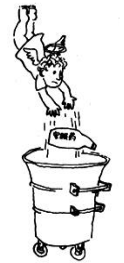
把安眠药扔进垃圾箱

1993年6月在意大利举行的第三届世界“老化和癌症”高级会议，掀起了世界性脑白金热。1997年4月在东京召开了第四届会议，这次会议举世瞩目。