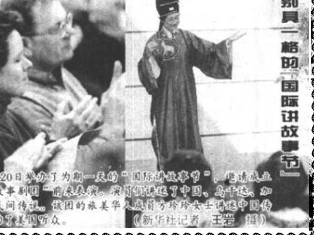
别一格国际讲故事

据新华社伦敦3月20日电(记者 毛磊)美国科学家对海尔一波普彗星1997年回归时获取的观测数据进行了研究后提出,该彗星中可能包含相当多的原始物质。这些物质也是太阳系形成时的原始物质。 美国加利福尼亚理工学院布莱克教授及其同事在最新出版的英国《自然》杂志上撰文说,他们对射电望远镜拍摄的高分辨率观测图像进行分析后发现,海尔一波普彗星彗核中喷射出有弧状的挥发性混合物。这些混合物主要由氢同位素氘、氦以及包含氦的重水组成,与星际星云和一些星体的成分非常近似。科学家们认为,这表明海尔一波普彗星中很可能保留了太阳系形成初期的一些原始物质。据推测,这些物质在海尔一波普彗星总质量中可能占到15—40%。