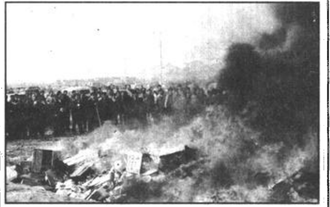
近日，广饶县技术监督局在广饶县商贸城举行了“销毁假冒伪劣商品大会”，共销毁假冒伪劣商品价值3万余元，其中包括农药、化肥、农机配件、汽车摩托车配件及烟酒假酒100余种，在场群众拍手称快。

本报讯 近年来，东营区海河路街道办事处南王居委会紧紧抓住机遇，充分发挥区位优势，以第三产业的发展为龙头，以增加集体积累，提高居民收入为宗旨，坚持“工贸一体化，内涵、外延并举”的工作方针，集体经济迅猛发展，居民收入有了显著提高。